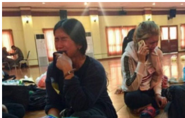
Ảnh chụp tháng 8, 2018: phụ nữ VN bị bắt và các con nhỏ bị tách ra giam nơi khác.

133 người Việt tị nạn bị giam giữ trong Trung tâm giam giữ nhập cư (IDC) vì tình trạng bất hợp pháp của họ mặc dù họ đã có qui chế tị nạn.